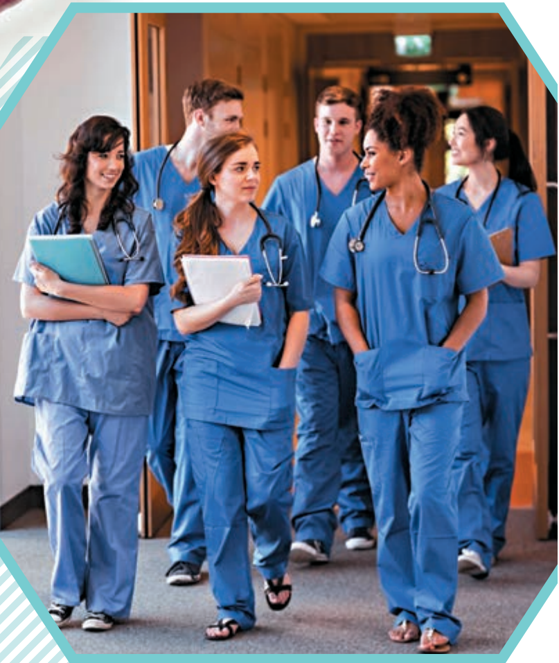
歐美發達國家紛紛從海外輸入醫生，紓緩人手短缺。 網上圖片