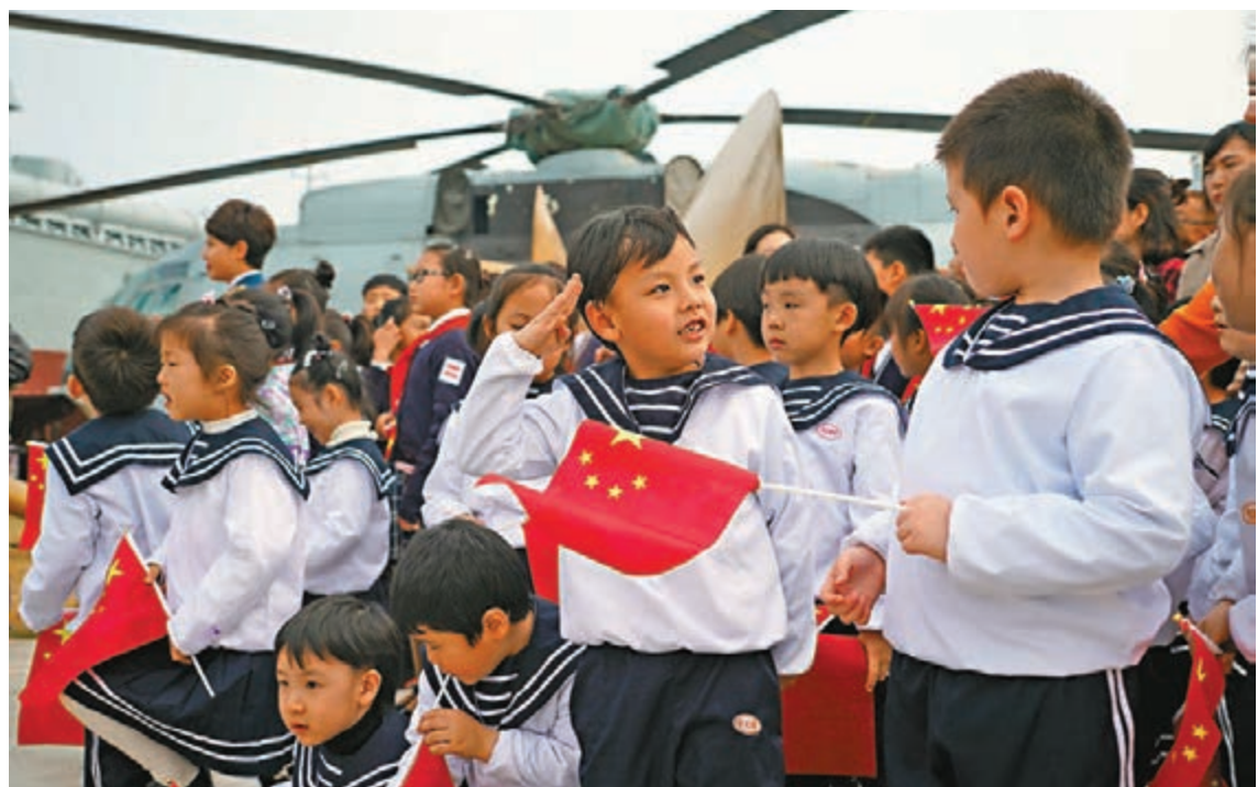
在青島海軍博物館舉行的慶祝海軍成立70周年的活動上，一名身穿水手服的小朋友向身邊的夥伴敬軍禮。

軍委機關領導、部隊英模代表、海軍機關和駐京單位官兵代表等1,300餘人參加大會。