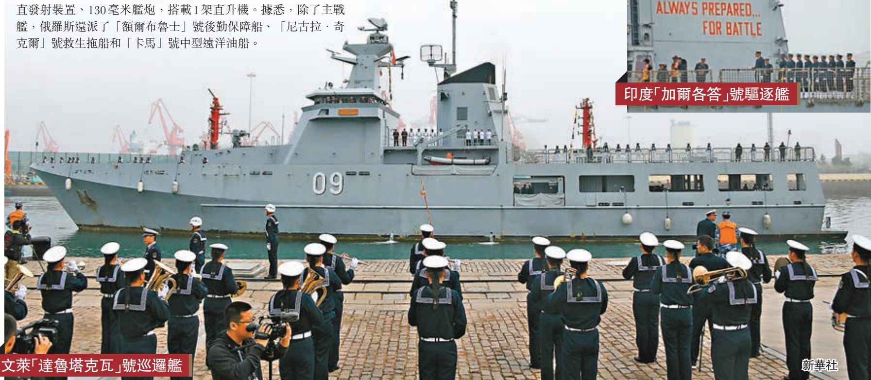
文萊「達魯塔克瓦」號巡邏艦