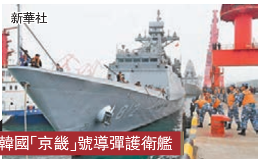
韓國「京畿」號導彈護衛艦