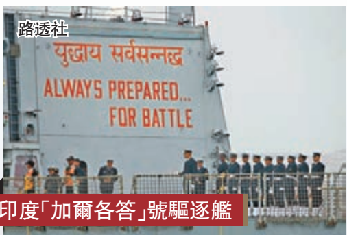
印度「加爾各答」號驅逐艦