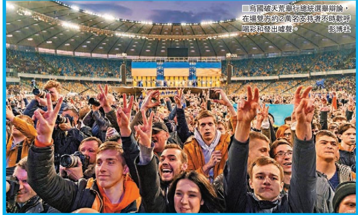
烏克蘭破天荒舉行總統選舉辯論，在場雙方約2萬名支持者不時歡呼喝彩和發出噓聲。