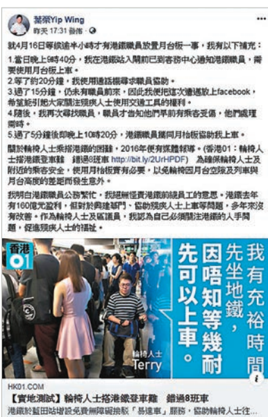
葉榮發帖解釋卻越描越黑。

深水埗站有位貴客坐著龍椅與友人大駕光臨，由於招呼不週，令其龍椅大怒，並在fb斬碎種種委屈。不過，此君並無和盤托出整個事件，當時站員正在替一流血不止的乘客按壓止血，另一站員call白車在路面等救護員，根本冇人手放板，職員已向其解釋正在救人中要稍等，然而似未能令其諒解，還叫友人幫他拍照，此君希望各位理性討論，卻未交得來往去罷，如果事件真的存在安全隱患，恐怕會日如果職員放下流血乘客不顧，熱情招待尊貴的議員，肯定存有安全問題。」