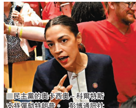
民主黨的奧卡西奧-科爾特斯支持彈劾特朗普。