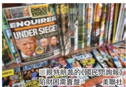
親特朗普的《國民問詢報》陷財困需賣盤。 美聯社

事件東窗事發後，AMI去年遭聯邦檢察官調查，並與當局達成認罪協議，不過在兩個月前，網購龍頭亞馬遜創辦人員索斯公開指控《國民問詢報》，斥責該報以公開他的私密照片進行勒索，引起檢察部門關注，質疑AMI違反認罪協議，面臨巨額罰款。 ■美聯社