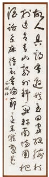
■于右任書孟浩然詩《過故人莊》。

品，「得山水清氣，極天地大觀」10個字蒼勁有力、瀟灑飄逸。這件作品雖然是標準草書寫法，但書法的氣勢和氣韻卻有北魏的精神，也有中國古典歷代草書的寫法，運筆行雲流水跌宕起伏，非常講究，流露出于右任對書法追求自然的大美，是一件不可多得的珍品。據悉，在2015年的一場拍賣會上，同樣內容尺幅相近的作品，成交額高達322萬。此外，這件作品的上款人名為楊凱陵，是民國時期國民政府高官吳稚暉的秘書，當時和于右任關係非常親近，因而這件作品也具有一定的歷史意義和價值。