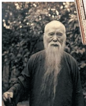
■中國近現代傑出的政治家、教育家、書法家于右任先生。

主辦方希望通過這樣一種紀念方式，讓大家在「一代書聖」曠世風采的同時，亦能進一步在海內外廣泛傳播中國書法文化。 ■文：香港文匯報記者 李陽波