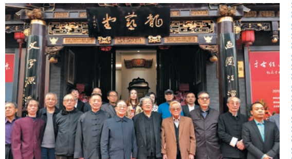
■陝西藝術節眾多名家出席「于右任先生遺墨文獻展」開幕式。

獻資料及海內外著名書法展，在于右任的故鄉陝西三原舉辦「百年巨匠于右任先生書法作品展」，6月3日則將移師香港舉辦「于右任先生遺墨文獻巡展暨于右任書法流派國際邀請展」。