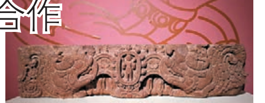
■柬埔寨國家博物館藏砂岩門楣。

頭、波蘭華沙國家博物館藏中國風格的伊朗瓷盤、哈薩克斯坦國家博物館藏的黃金武士；海上絲綢之路沿線國家的展品中，有柬埔寨國家博物館藏銅鼓、韓國國立中央博物館藏唐三彩三足罐、日本東京國立博物館藏突線銅鈸、阿曼國家博物館藏哈德拉毛語雕刻飾板等。這些文物充分展示了「一帶一路」沿線各國在科技藝術的融合互鑒、交匯碰撞的廣度和深度。 記者在現場看到了多件國外博物館藏的中國文物，此次歸國展出。例如波蘭國家博物館藏的多種清代琺瑯和瓷器，以及阿曼蘇丹國家博物館藏的南宋或元早期龍泉青瓷碗等。