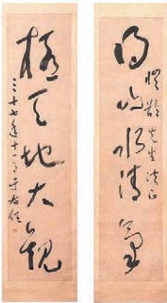
■于右任書法作品《草書五言聯》。

另外一件書法條幅寫孟浩然詩《過故人莊》也是一件難得的精品，這首家喻戶曉的古詩在于右任先生的筆下更是熠熠生輝。比較特別的是這件作品沒有上款，專家們推測有可能是于右任當時比較滿意和喜歡這件作品，因而自己留存在家。整副作品以標準草書一揮而就，用筆的老辣和變化，筆畫轉折都很高妙。雖然是一幅靜態的書法作品，但卻像行雲流水的畫面一樣，展示給觀者一種輕鬆、愉悅的感覺。