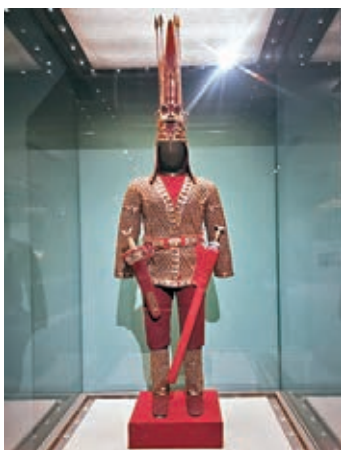
■哈薩克斯坦共和國國家博物館藏黃金武士(復原)。

「殊方共享——絲綢之路國家博物館文物精品展」日前在中國國家博物館開展。來自13個「一帶一路」沿線國家的234件(套)古代文物精品，共同展現「絲綢之路」沿線及世界範圍內各個歷史時期文明之間的交流互鑒。 橫跨歐亞的陸上絲綢之路和連接非洲的海上絲綢之路，距離長、歷史久，它們的故事從何講起？答案就藏在展覽的名字中——「殊方共享」。「殊方」一詞源出中國漢朝班固所著《西都賦》，意為遠方異域。「殊方共享」就是要讓世界人民共享人類文明之光。國家博物館館長王春法表示，古代絲綢之路綿亙幾萬里，延續數千年，積澱形成了跨越時空、超越國界、富有永恒魅力、具有當代價值的絲路精神，即「和平合作、開放包容、互學互鑒、互利共贏」。 今次國博聯合「一帶一路」沿線的柬埔寨、日本、哈薩克斯坦、拉脫維亞、蒙古、阿曼、波蘭、韓國、羅馬尼亞、俄羅斯、斯洛文尼亞、塔吉克斯坦12個國家博物館共同舉辦展覽，精挑細選各個時期、不同門類的234件(套)歷史文物展出，實證絲綢之路沿線國家豐富多樣的文化交流，包括人口遷徙、經貿往來、科技交流、宗教傳播以及生產生活方式、文化藝術的相互影響等。 海陸絲綢之路在此次展覽中同場呈現。陸上絲綢之路沿線國家的展品中，有俄羅斯國家歷史博物館藏的葉形矛