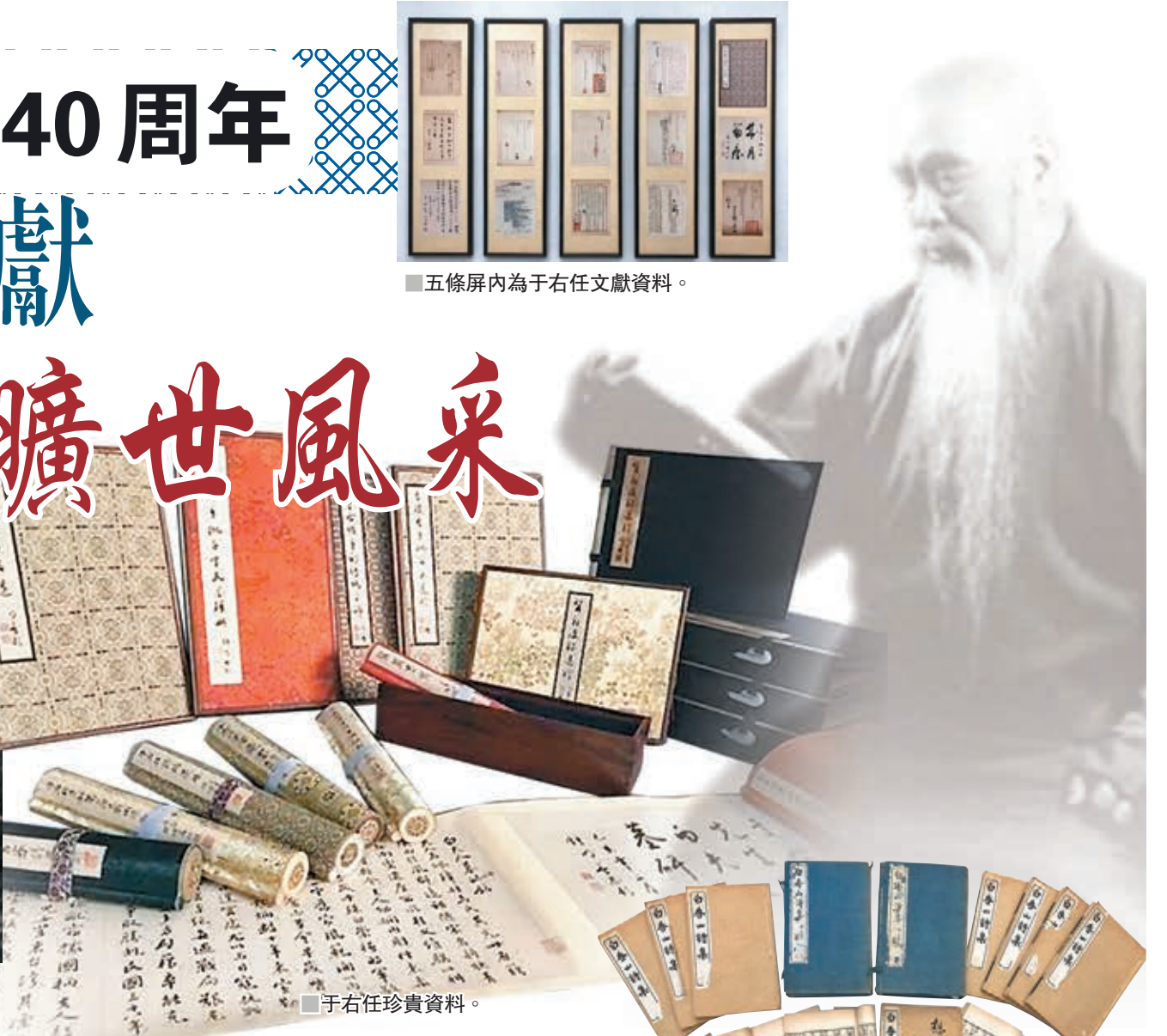
■五條屏內為于右任文獻資料。