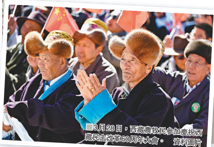
3月28日，西藏農牧民參加慶祝西藏民主改革60周年大會。資料圖片

「建設美麗西藏」單元，集中展示了民主改革60年來，尤其是十八大以來西藏自治區在政治、經濟、文化、生態等各個方面取得的巨大成就。看到日益繁榮的新西藏，生活愈加富足的西藏人民，十一世班禪連連點頭，為西藏民主改革以來取得的輝煌成果，由衷讚歎。 十一世班禪表示，「不是中國共產黨單方面要在西藏進行民主改革，而是在西藏人民長期而強烈的期盼下，中國共產黨順應民心，進行了民主改革。正如我的前世十世班禪大師所說，『1959年，是西藏人民取得決定性勝利的一年。』這個展覽可以讓更多的海內外人士及年輕人了解歷史真相，珍惜得來不易的改革成果和幸福生活。同時，也激勵大家再接再厲，創造更美好的未來。」