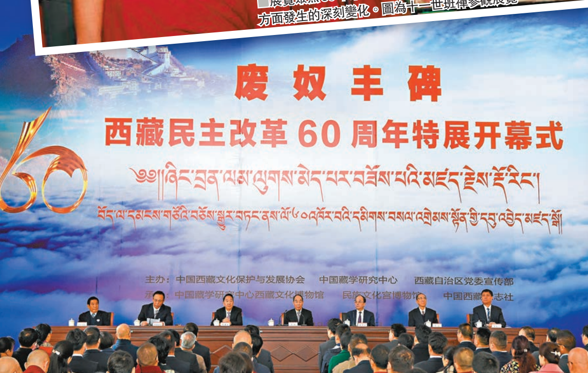
3月29日，「廢奴豐碑——西藏民主改革60周年特展」在北京西藏文化博物館開幕，中共中央書記處書記、中央統戰部部長尤權出席開幕式並致辭。資料圖片