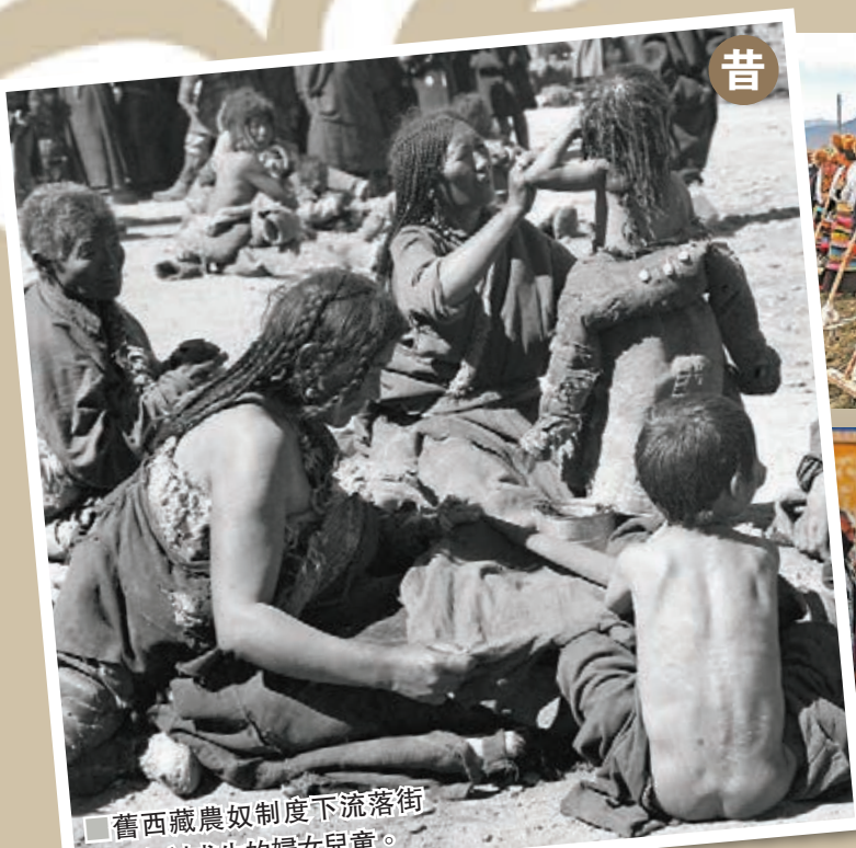
舊西藏農奴制度下流落街頭、乞討求生的婦女兒童。