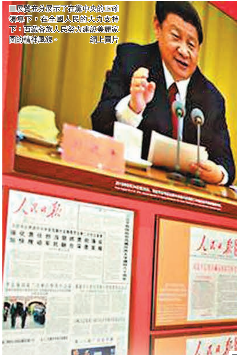
展覽充分展示了在黨中央的正確領導下，在全國人民的大力支持下，西藏各族人民努力建設美麗家園的精神風貌。

香港文匯報訊 據中國西藏網報道，「廢奴豐碑——西藏民主改革60周年特展」上月29日在北京西藏文化博物館開幕，中央書記處書記、中央統戰部部長尤權出席開幕式並致辭。尤權指出，在西藏民主改革60周年之際，舉辦「廢奴豐碑」展覽，深刻揭露舊西藏政教合一封建農奴制的黑暗，全面展示西藏從黑暗走向光明、從落後走向進步、從專制走向民主、從貧窮走向富裕、從封閉走向開放的光輝歷程，意義重大。十一世班禪額爾德尼·確吉傑布日前在參觀展覽時，也由衷地讚歎西藏民主改革以來取得的輝煌成果。