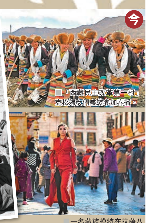
一名藏族模特在拉薩八廓街走過。資料圖片