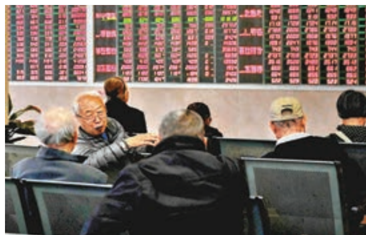
市場對流動性擔憂升溫，導致昨日A股表現不盡人意，滬深指數高開低走，最終全線收綠。