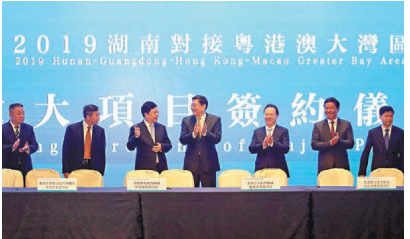
湖南省委書記杜家毫、中聯辦副主任譚鐵牛等昨日見證簽約儀式。