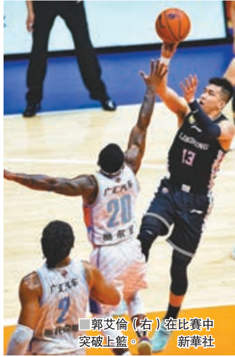
郭艾倫(右)在比賽中突破上籃。

本屆CBA季後賽準決賽日前在烏魯木齊開戰，由新疆匯豐汽車與遼寧本鋼進行第三回合的比賽。依靠郭艾倫的下半場爆發，衛冕冠軍遼寧最終以109:100客場翻盤，將大比分扳成1:2，在7場4勝制的系列賽中搶回一線生機。