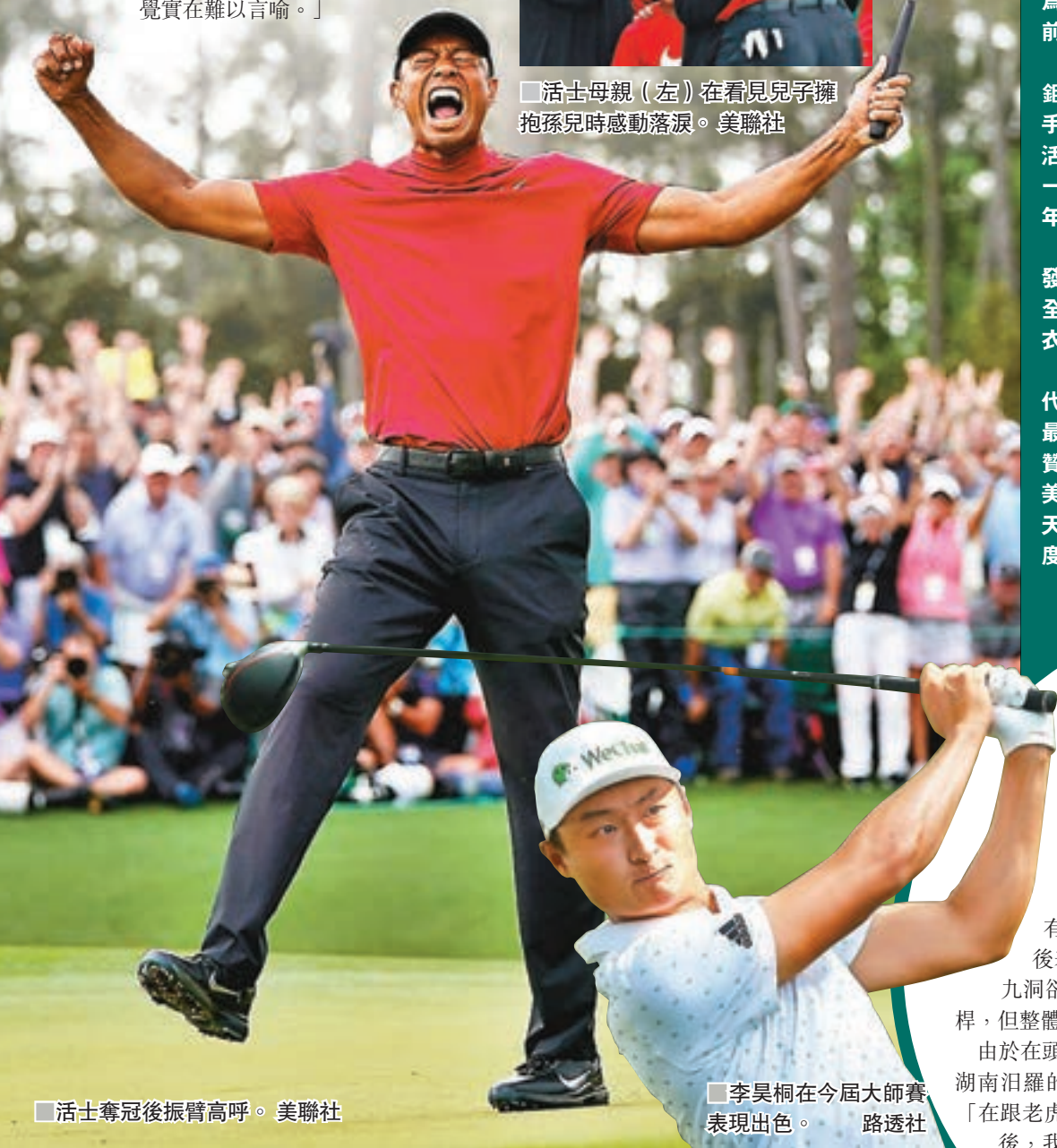
活士奪冠後振臂高呼。