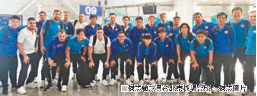
傑志職球員於北京機場合照。

此外，和富大埔周三晚上亦會於主場迎戰中國台北航源，客軍已定於今晨抵港，晚上即到旺角場作最後檢閱。