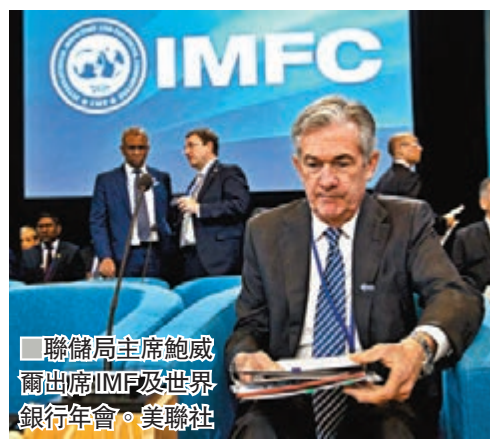
■聯儲局主席鮑爾出席IMF及世界銀行年會。