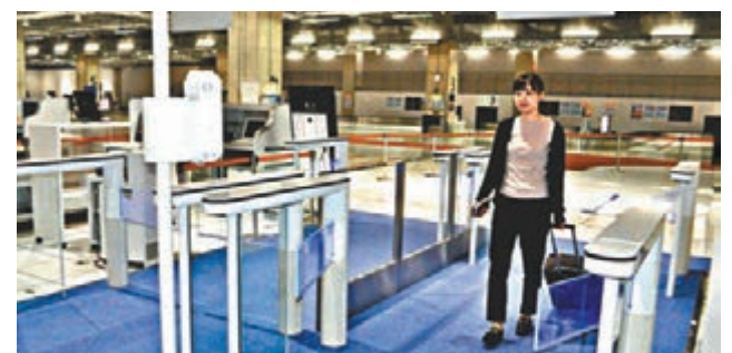
■旅客可使用設有面容識別系統的自動通道入境。 網上圖片