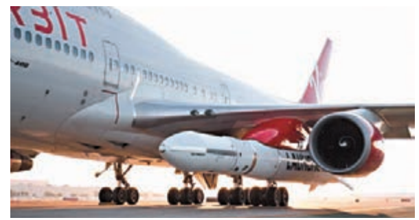
■「發射者一號」經改裝的波音747-400 搭載升空。