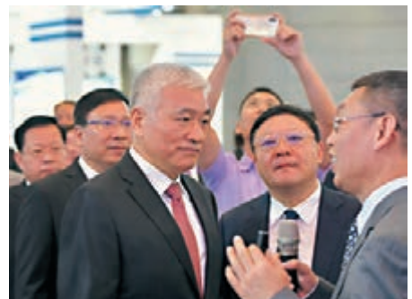
中國科學技術部部長王志刚(右三)、深圳市委書記王偉中(右二)等出席大會。

王雷表示,香港和珠海在集成電路、生物醫藥、航空航天、電子信息等方面融合度很高,這些領域對於香港高校來說是強勢學科,同時也是珠海的支柱產業。「我們特別希望香港這些領域的科技人才能夠