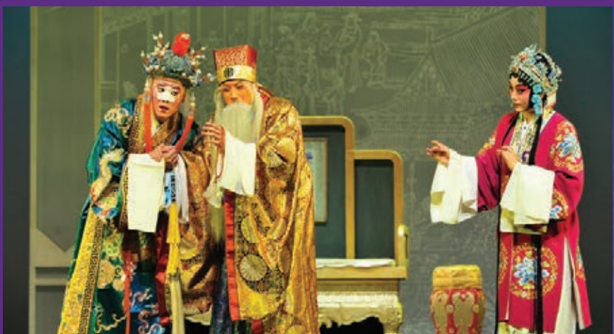
《邯鄲夢》 2.5.2019 藍天 | 陳莉