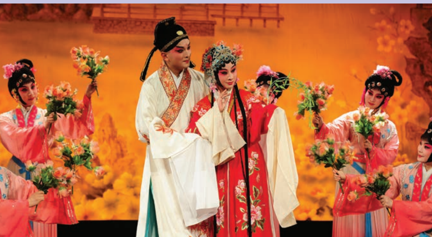
《牡丹亭》 5.5.2019 黎安 | 羅晨雪

晚上 7:30 戲曲中心大劇院 票價 $500 $420 $320 $200 演出輔有中文字幕。