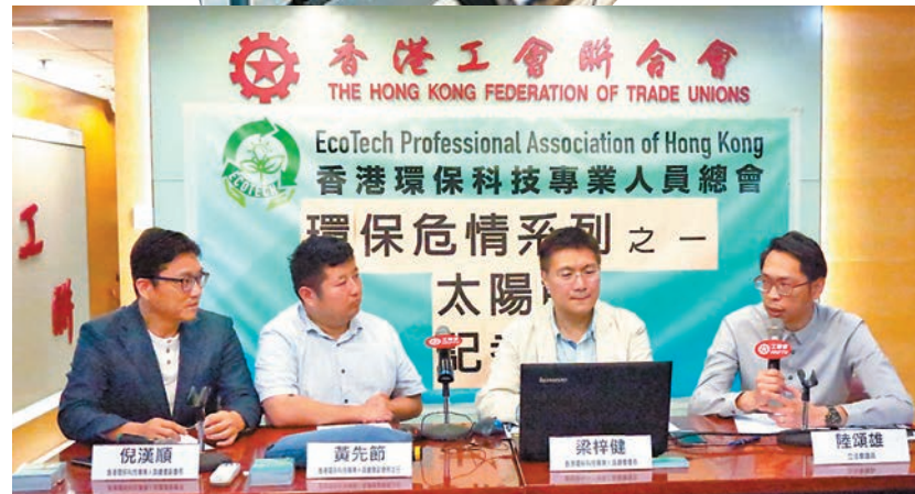
香港環保科技專業人員總會要求政府早日制定太陽能板回收計劃。

香港文匯報訊(記者 殷翔)政府致力發展太陽能清潔能源,據特區政府2030氣候藍圖規劃,香港總用電量的1%至1.5%電力將由太陽能供應,預計香港2030年的總用電量為每年522億9千5百萬度,太陽能按計劃需每年供應7億8千4百20萬度。工聯會屬會、香港環保科技專業人員總會昨日召開名為「環保危情系列之一太陽能」記者會,指出太陽能板使用壽命為15年到25年,按政府計劃,未來將產生3萬噸至4萬噸含重金屬的廢棄太陽能板,需未雨綢繆,及早制定環保回收計劃,以免大量重金屬棄置物品令堆填區不勝負荷,污染環境。