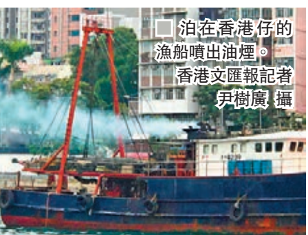
泊在香港仔的漁船噴出油煙。