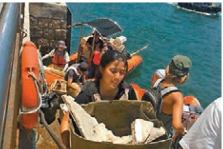
「守護香港仔海港聯盟」清理香港仔避風塘垃圾時，發現不少發泡膠製品。

同時，部分建築物的污水渠或錯誤駁上雨水渠，家居廢物及污水可能沖入大海，而渠務署已在不少地區裝設旱季截流器，把雨水渠受污染的早流堵截及分流至污水收集系統，減少臭味。