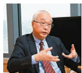
環境局副局長謝展寰接受香港文匯報專訪。

謝展寰表示，政府設立的「海洋環境管理跨部門工作小組」已加強在颱風來襲前清理海邊垃圾，並設立網上平台，於颱風過後即時聯絡社會團體及地區組織清理垃圾。