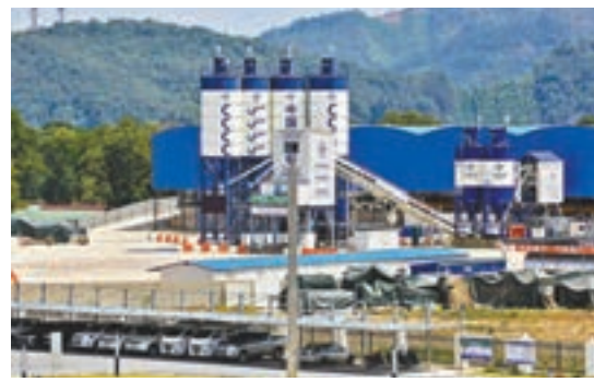
中馬達成協議，將為恢復東海岸鐵路項目鋪平道路。

海岸鐵路項目鋪平道路。成本削減肯定會使馬來西亞受益，並減輕該國財政狀況的負擔。據悉，修訂後的協議將於下周宣佈，馬哈蒂爾的辦公室表示，他將在周一就該項目舉行新聞發佈會。