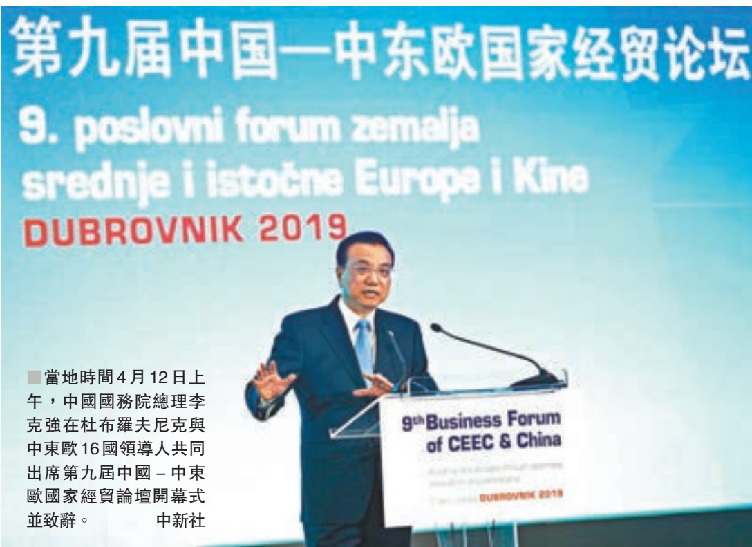
當地時間4月12日上午，中國國務院總理李克強在杜布羅夫尼克與中東歐16國領導人共同出席第九屆中國—中東歐國家經貿論壇開幕式並致辭。

來自中國和中東歐國家政府和工商界代表1,000餘人出席論壇開幕式。王毅、何立峰參加上述活動。