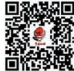
掃國家稅務總局二維碼可查詢細則

對於無住所個人按照稅收協定(包括內地與香港、澳門簽訂的稅收安排)居民條款為締約對方稅收居民的，文件稱，「即使其按照稅法規定為中國稅收居民，也可以按照稅收協定的規定，選擇享受稅收協定條款的優惠待遇」。主要優惠待遇包括：境外受僱所得協定待遇、境內受僱所得協定待遇、獨立個人勞務或者營業利潤協定待遇、董事費條款規定、特許權使用費或者技術服務費協定待遇。