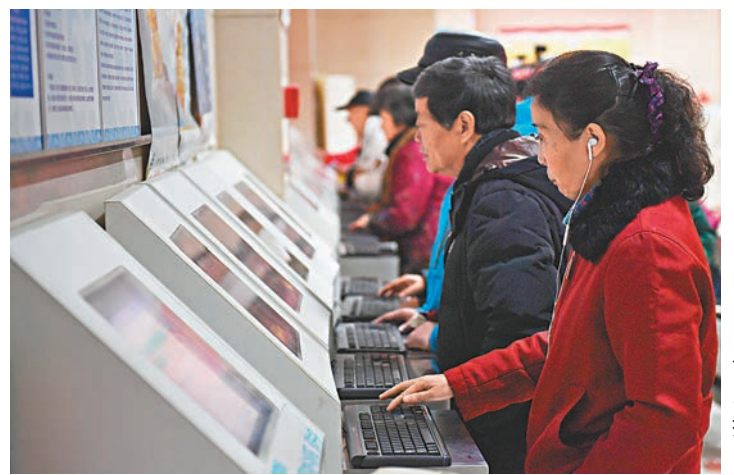
內地股民在電腦上瀏覽股市數據。