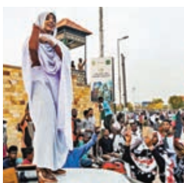
■薩拉赫站在車頂叫喊口號。

蘇丹喀土穆新一輪反政府示威中，一名白袍女子的片段及照片在網上瘋傳，網民將她稱為「努比亞女王」，視為示威象徵。