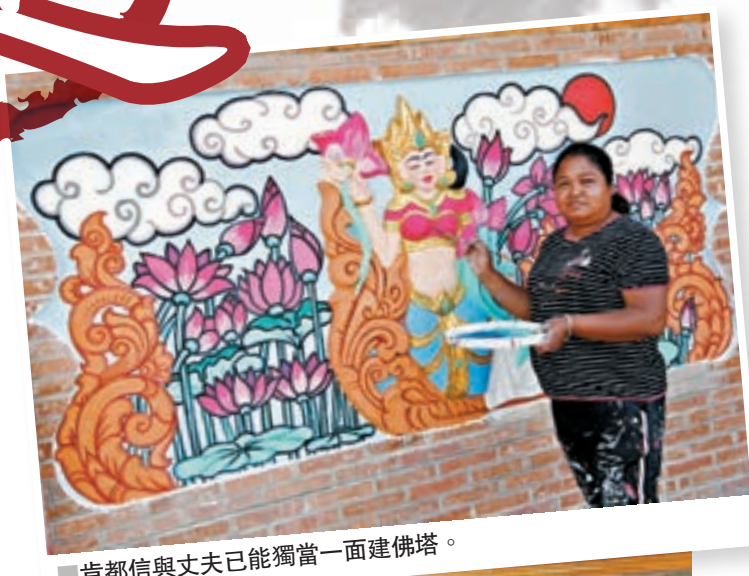
肯都信與丈夫已能獨當一面建佛塔。