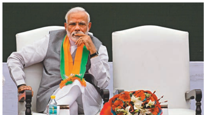
莫迪領導的執政人民黨有望在大選贏得大多數議席。