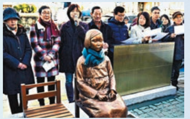
使館外的慰安婦少女銅像。

日本駐韓國首爾大使館的新使館施工許可，昨日被當地政府以超過兩年仍未動工為由取消。韓國傳媒報道，當局此前曾經多次催促使館開始施工，但日方一直以各種理由推遲，懷疑日本政府是因為不滿設在新使館地盤前的慰安婦少女銅像，因此拒絕動工。