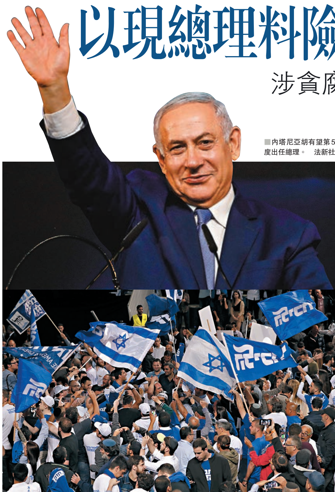
內塔尼亞胡有望第5度出任總理。