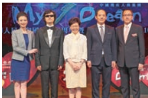
林鄭月娥、王峰、施榮忻與中國殘疾人藝術團代表合影留念