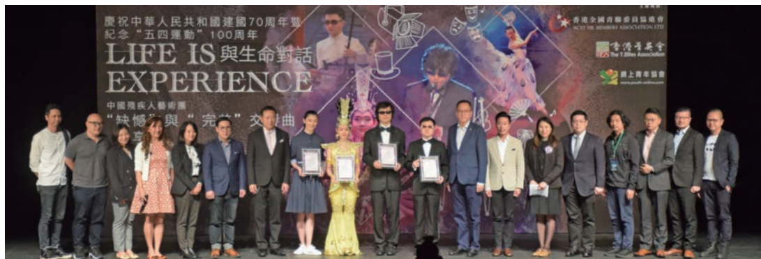
主辦機構向藝術團代表頒發感謝狀合影