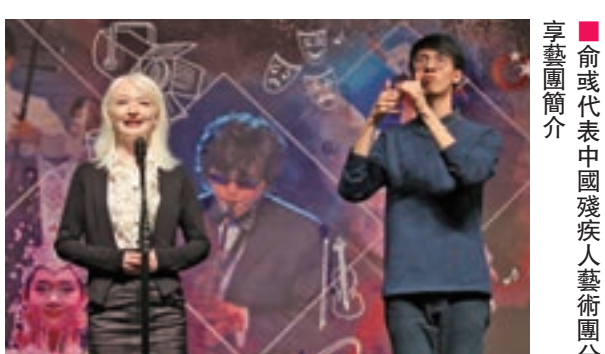
俞或代表中國殘疾人藝術團分享藝術團簡介