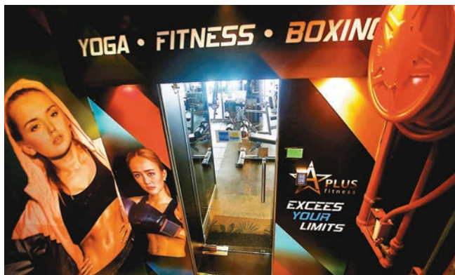
▲ A Plus Fitness 職員慫恿一名「腦白質病變」女子購入15年健身會籍及1,050節私人教練課堂，總值逾175萬元。

香港文匯報訊(記者 殷翔)健身中心的不良銷售情況死灰復燃，消委會昨日罕有地點名批評4間健身中心，涉嫌專門向心智未成熟的青年，或自閉、智障等無行為能力的人士，以高壓手法強迫他們購買會籍或課程，損失最慘重的事主為「腦白質病變」患者，她曾被健身中心帶到財務公司借錢，先後繳付約175萬元買會籍。另有事主被要求以電器禮券或電子支付方式繳付會費，職員還迫他們拍片聲稱在自願情況下簽約，增加追查及舉證難度。一名受害人接受香港文匯報獨家訪問時，描述當時的情景猶如「揪住嚙搶」。