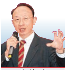
黎偉成 資深財經評論員