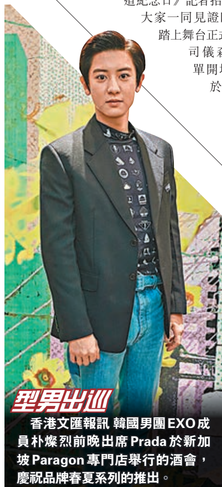
香港文匯報訊 韓國男團EXO成員朴燦烈前晚出席Prada於新加坡Paragon專門店舉行的酒會，慶祝品牌春夏系列的推出。

臨完場之際，環球「大師兄」陳奕迅（Eason）突然驚喜現身，從台下走上特設T台，為剛完成表演的Fabulous Four送上祝福。Eason把「車牌」禮物送給四組新星，寓意Fabulous Four在樂壇考牌成功，於歌手路上將乘風前行，而這個國際車牌的設計更是期望他們將會一路順風，衝出香港，把音樂帶到世界各地！Eason表示替環球唱片高興，有一眾新生代誕生，可惜不是自己所簽的新人，但見到他們都有獨特風格，欣喜公司越來越多人，笑言叫公司要搬更大寫字樓了！