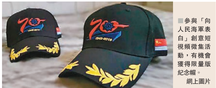
參與「向人民海軍表白」創意短視頻徵集活動，有機會獲得限量版紀念帽。

另外，中國之聲國防時空、解放軍新聞傳播中心融媒體透露，在人民海軍成立70周年紀念日即將來臨之際，《名家談軍事》系列節目將為聽眾講述人民海軍精神中「海上先鋒精神」、「海上猛虎精神」、「海空雄鷹精神」、「西沙精神」、「南沙精神」、「核潛艇精神」等背後的故事。