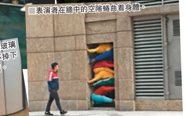
表演者中有香港人

最令記者難忘的表演動作是十名表演者纏繞在攀爬架迷宮陣上，專業的表演者動也不動、沒有表情的纏繞在攀爬架上，不禁讓人以為在攀爬架上的並非真人。而為配合表演者在迷宮陣上的動作，L'Atlas 在設計攀爬架時也特別注意可承受重量的物料。