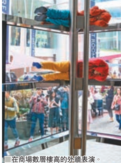
在商場數層樓高的外牆表演。