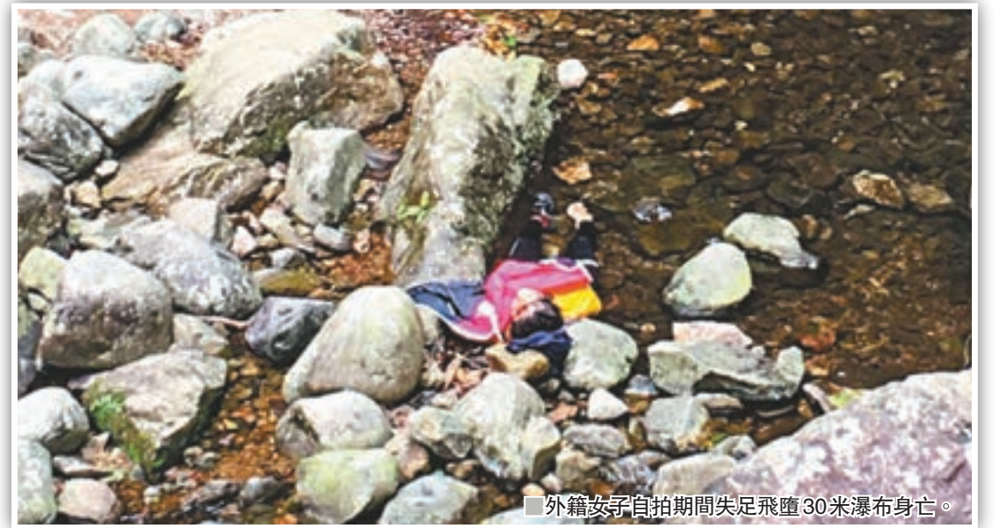
外籍女子自拍期間失足墮30米瀑布身亡。

香港文匯報訊（記者 蕭景源）繼上周五一名來港報名參團澳門男子在美國大峽谷的老鷹岩崖邊自拍時失足墮崖死亡，被喻為「香港四大自然奇景」之一的大埔梧桐寨瀑布，昨日亦發生外籍女子在主瀑布邊用手機自拍期間，失足跌落約30米下水潭重傷昏迷，由直升機救出送院不治。警方調查無可疑，列作「送院時死亡」案處理。這宗已是過去三年最少第六宗因自拍失足墮下死亡意外，專家提醒自拍者應該注意四周環境是否安全，絕不值得為影一張相而冒上生命危險。