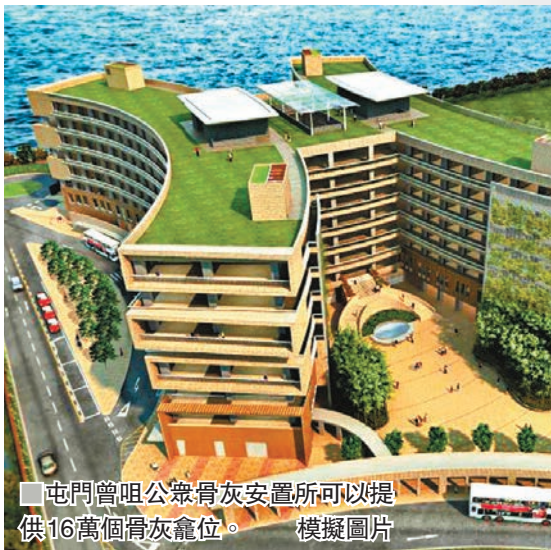
屯門曾咀公眾骨灰安置所可以提供16萬個骨灰龕位。模擬圖片

香港文匯報訊（記者 顏晉傑）香港每年有逾4萬人過身，私營龕場近年卻一直凍結出售龕位，食環署亦自2014年後未有新的骨灰安置設施落成，以致新龕位配對數目大幅下跌。即使食環署上月向屯門區議會透露，本季會再有兩萬個新龕位供市民申請，但仍是杯水車薪。