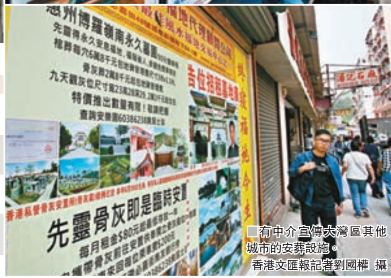
有中介宣傳大灣區其他城市的安葬設施。