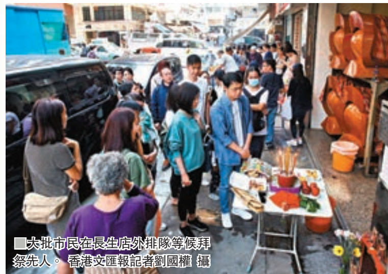
大批市民在長生店外排隊等候拜祭先人。

香港文匯報訊（記者 顏晉傑）不少市民在清明節都會拜祭先人，但香港骨灰龕位嚴重不足，不少人都須將先人骨灰暫時存放在「長生店」，故昨日除了各個墳場外，開設有不少「長生店」的紅磡一帶同樣是人山人海，有市民要輪候約1小時才能獲安排拜祭，而且拜祭時可能香燭未燒完就被要求離開。