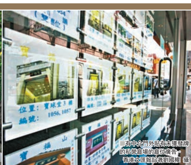
有中介門外貼有未獲發牌的私營龕場的龕位廣告。