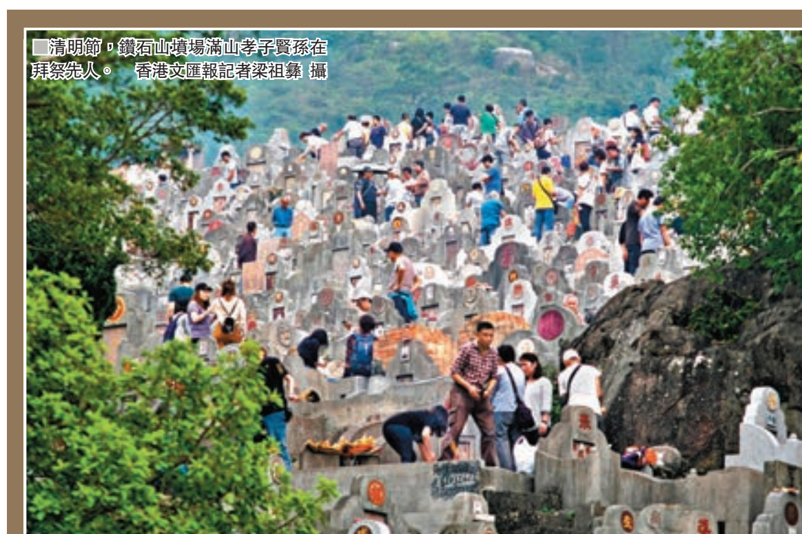
清明節，鑽石山墳場滿山孝子賢孫在拜祭先人。

不少中介並以廣深港高鐵路及港珠澳大橋在去年相繼開通令往返兩地交通時間大幅縮短為賣點，有代理聲稱「懷集萬福墓園」的宣傳品指，全程交通時間不需2小時。職員陳小姐向香港文匯報記者透