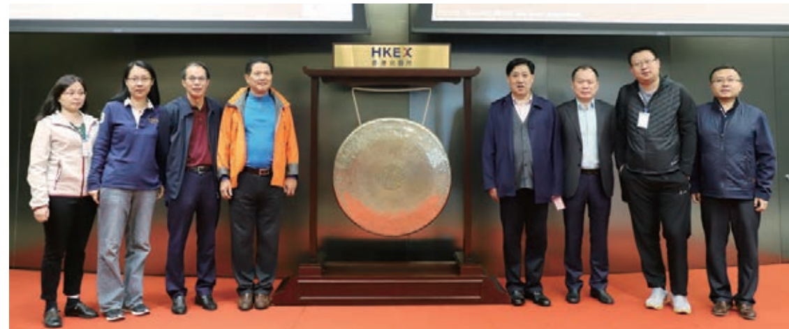
北京註冊會計師行業代表團參訪港交所