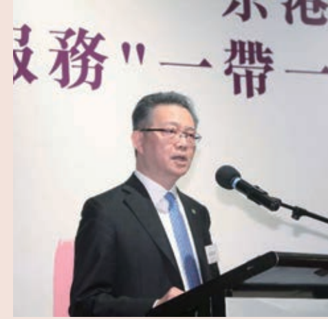
香港會計師公會會長羅富源在兩地事務所合作簽約儀式上致辭