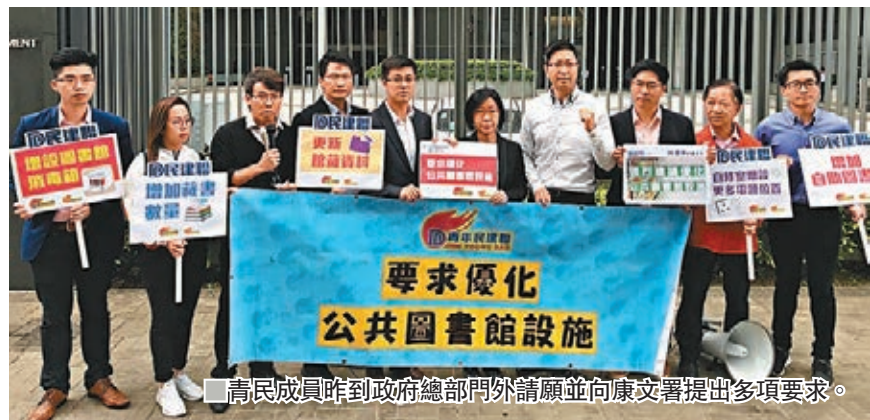
青民成員昨到政府總部門外請願並向康文署提出多項要求。

青民同時建議增加藏書數量,並廣納更多不同學科的資料以切合不同年齡市民的需要,同時增加不同國家語文的書籍,全面照顧少數族裔人士的閱讀需要;更新館藏資料供市民閱覽和研究;增加自助圖書館;於自修室增設更多電源位置,方便市民利用電子設備自學進修。