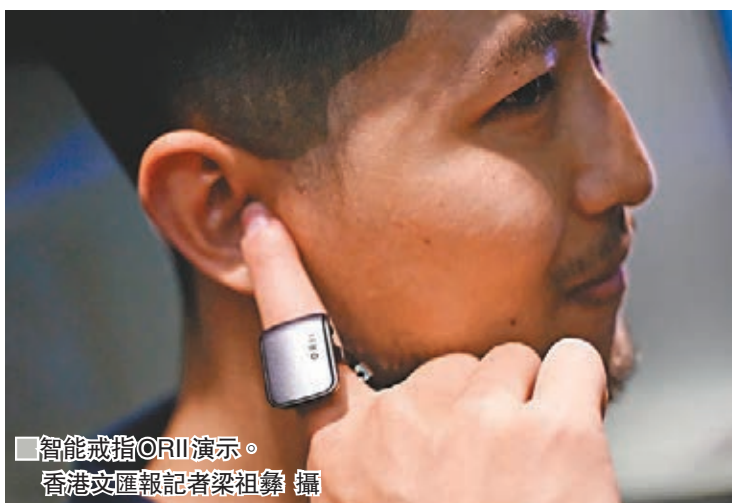
智能戒指ORII演示。

香港文匯報訊(記者 趙夢縈)南豐紗廠旗下的實驗式體驗店 Techstyle X 將於明天(4月6日)正式開幕,昨日進行傳媒預覽,多個將時尚生活與創新科技融合的新型店舖率先曝光。有租用展位的初創企業,研發自助式3D人體掃描儀,助顧客度身訂做服飾;有人研發糅合科技與時尚的戒指,能聲控電話。