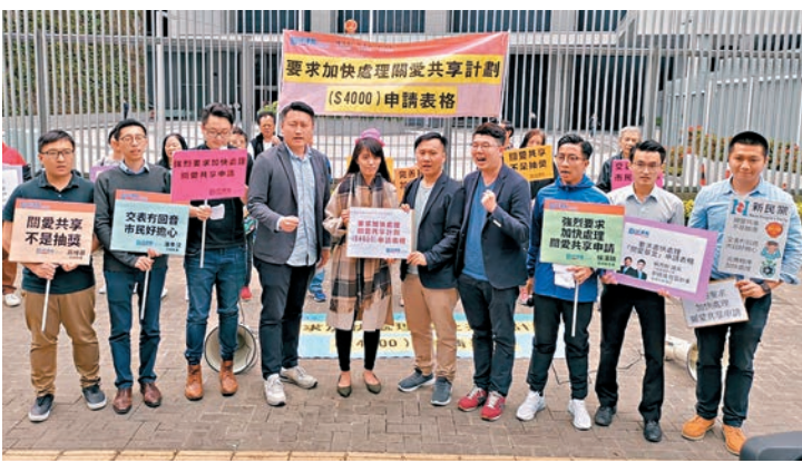
民建聯北區支部成員請願要求「關愛共享計劃」申請。

政府發言人回覆傳媒查詢時表示,截至本周三共收到約260萬份申請,並已向約150萬申請人發出申請確認通知。職津處會盡快發出餘下的申請確認通知,目標是於本月底前就2月及3月內收