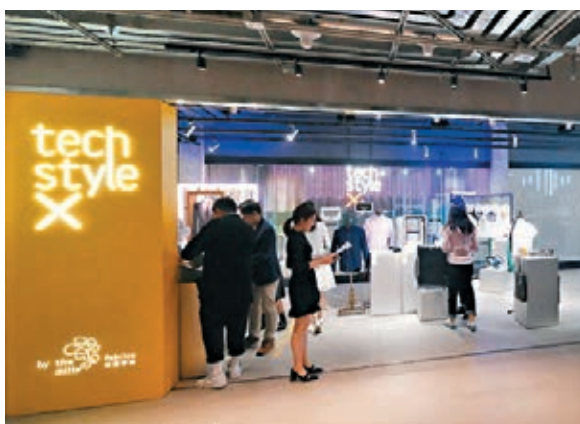
南豐紗廠首間體驗式體驗店 Techstyle X 開幕。

其中一間體驗店是 Origami Labs,它是南豐紗廠旗下的孵化初創公司,創辦人之一兼行政總裁黃家恆受到視障父親的啟發,研發了一款利用骨傳導技術的智能戒指 ORII,它是全球首隻聲控戒指,用家戴上戒指,先以手機藍牙連接戒指,此後只需要輕觸耳朵,便可隨時發訊息、打電話或聲控電話語音助理,過程毋須觸碰手機屏幕。Origami Labs 創立初期曾發起過眾籌,累積收到325萬美元(約2,535萬港元)創投資。