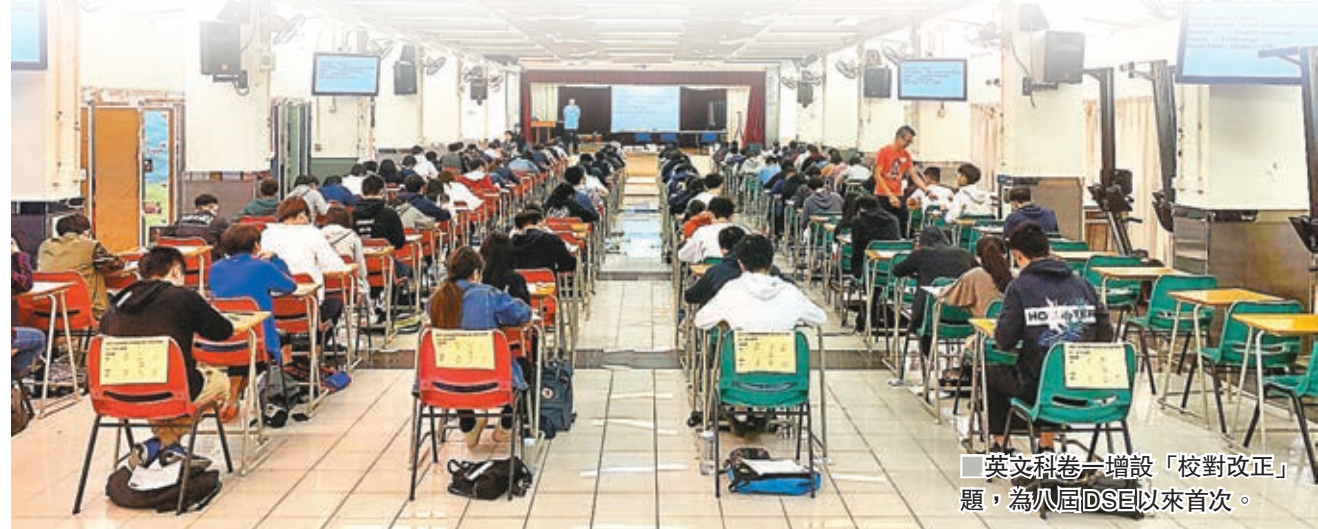
英文科卷一增設「校對改正」題，為八屆DSE以來首次。