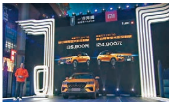
T77米粉定制智能車公佈價格。

香港文匯報訊(記者 孔雯瓊 上海報道)小米(1810.HK)昨推出有史以來最大件商品——和一汽奔騰合作的T77米粉