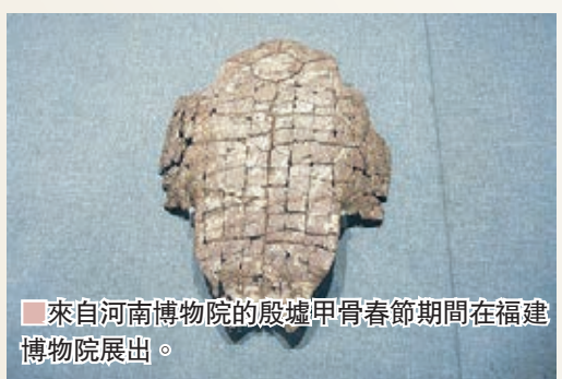
來自河南博物院的殷墟甲骨春節期間在福建博物院展出。

文的教學機制、加大甲骨文展示宣傳推廣力度、加快培育甲骨文師資隊伍、加快甲骨文宣傳推廣試點工作等五個方面加強甲骨文的宣傳推廣。馬蕭林說，「建議在小學和中學階段適當安排甲骨文普及課程，在高等院校開設甲骨文或與甲骨文相關的選修課程。對中小學語文教師開展甲骨文知識培訓、教育案例示範觀摩等活動，以便加快建立甲骨文師資隊伍。」