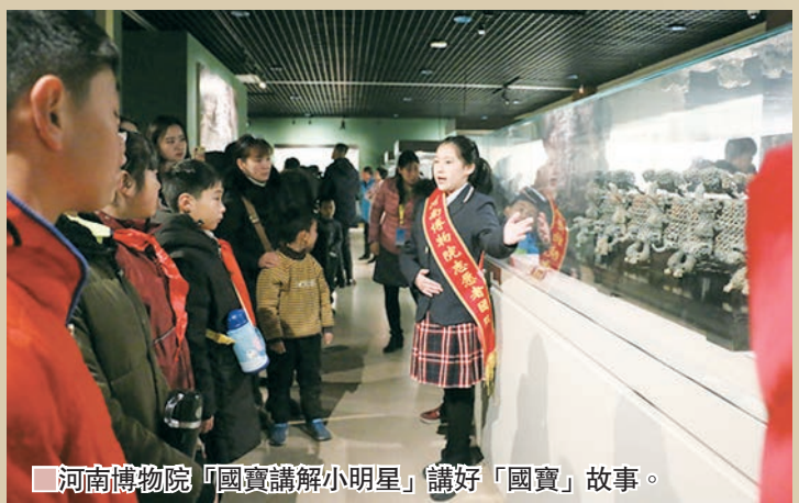
河南博物院「國寶講解小明星」講好「國寶」故事。