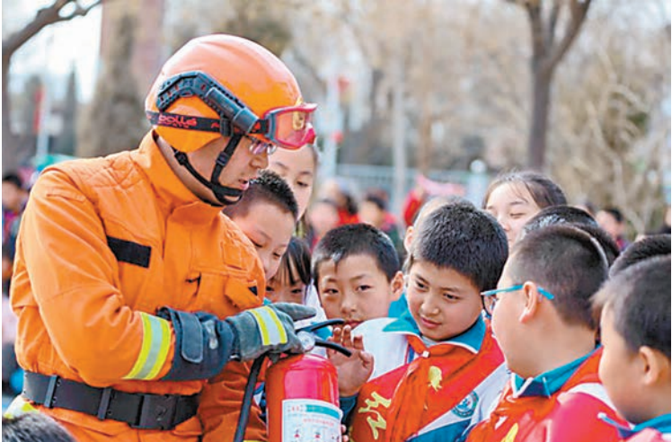
甘肅省森林消防隊員為當地小學師生講解乾粉滅火器使用方法。

如果不幸引火燒身，要馬上脫掉衣服，把火拍滅或踩滅。如果來不及脫衣服，立刻就倒地翻滾。請注意，這時就不能逆風奔跑了，會加大火勢，造成更嚴重的灼傷。而當順利逃出海後，不要放鬆警惕，要及時查看所有人是不是都在，如果有掉隊人員，要及時向救災人員求援。