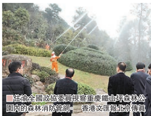
住渝全國政協委員視察重慶鐵山坪森林公園內的森林消防管網。