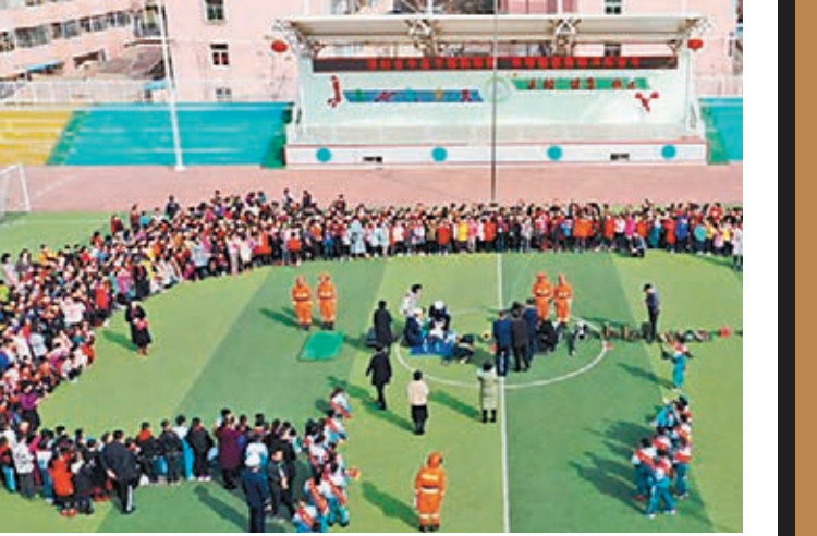
甘肅省森林消防隊員為當地小學師生普及生態保護、森林草原防火和校園安全常識。