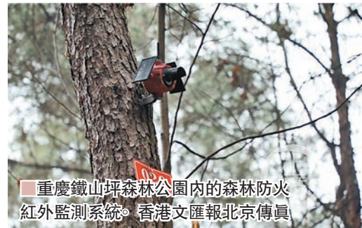
重慶鐵山坪森林公園內的森林防火紅外監測系統。

他建議，加大長江上游生態屏障建設的政策資金保障力度，統籌考慮山水林田湖草綜合治理，堅持宜林則林、宜灌則灌、宜草則草，持續推進天然林保護、退耕還林、石漠化治理、國家儲備林等各項工程建設和森林經營，開展高寒地區森林、濕地生態系統保護修復等科學研究工作。在建設過程中，既要考慮人民生產生活，也要考慮生態建設可持續性，走產業生態化、生態產業化道路。