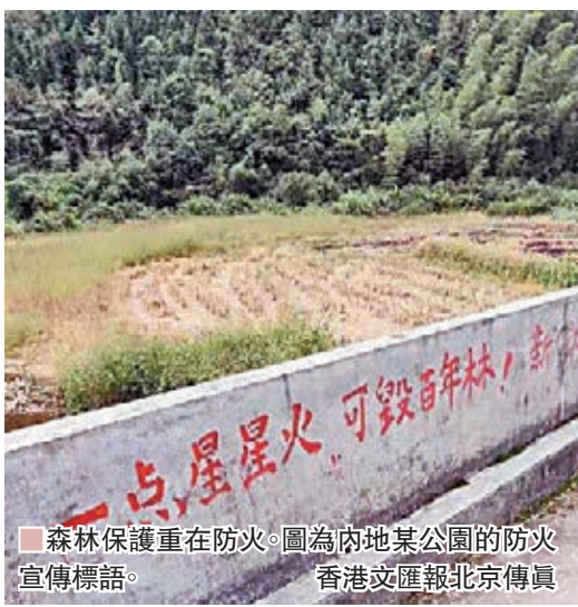
森林保護重在防火。圖為內地某公園的防火宣傳標語。

上，她分享了郴州的經驗和方法，並建議全省可探索建立山林責任制，「共識聚起來，建立良好機制；責任明起來，解決瓶頸制約；措施實起來，強化保障服務」。