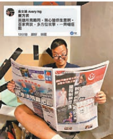
「東方昇」幫吳文遠打圓場，結果佢中多幾槍。