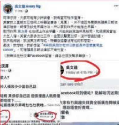
吳文遠出文指正杜汶澤。