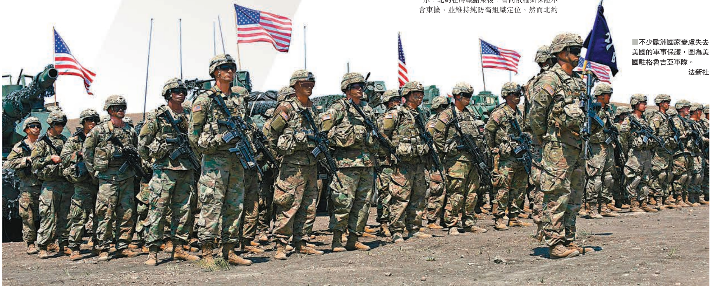
■不少歐洲國家憂慮失去美國的軍事保護，圖為美國駐格魯吉亞軍隊。