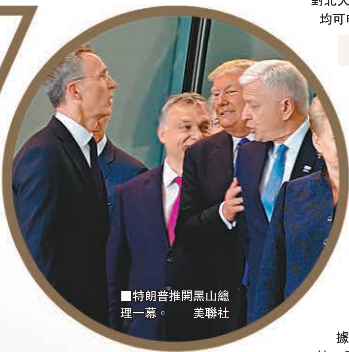
■特朗普推開黑山總理一幕。

美國過去一直扮演北約領導者，無論北約東擴或空襲南斯拉夫，美國均是重要推手。美國時任總統克林頓1999年慶祝北約成立50周年時，更表明美國在歐洲的防禦責任不變。