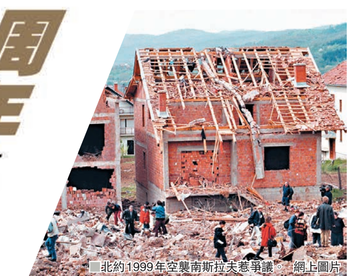
■北約1999年空襲南斯拉夫惹爭議。網上圖片