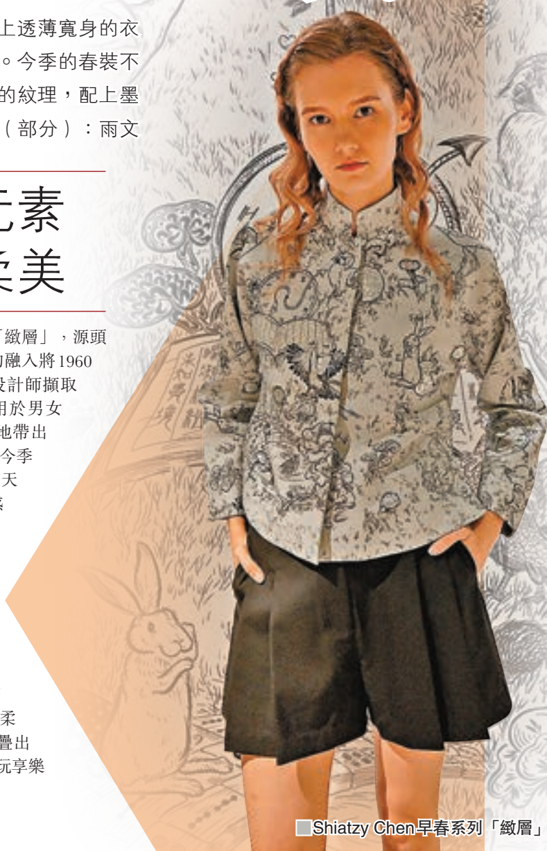
■ Shiatzy Chen 早春系列「緻層」

而今個春夏系列「凝麗」則打破時空界限，走入東方的奇幻異界，如夢境般朦朧而逐漸清晰，凝聚一幕幕白描圓點線至鮮明亮麗，其女裝系列以飄逸柔美的服裝輪廓，運用異材質堆疊出幻境樂園，融入品牌經典，詮釋翻玩享樂的豐富樣貌。