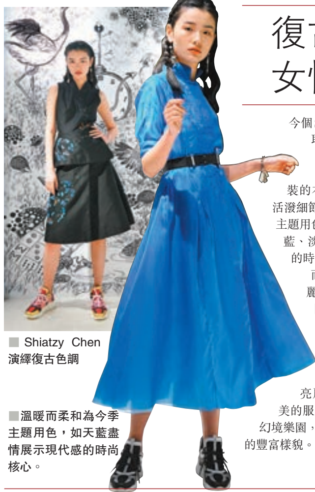
■ Shiatzy Chen 演繹復古色調