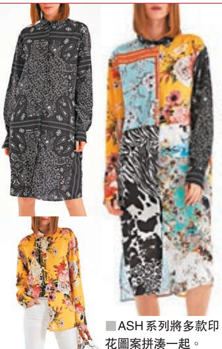
■ASH系列將多款印花圖案拼湊一起。

而且，牛仔也是今季的重點推介，其復古風的漂白牛仔布能呈現出女性線條，不論是長褲、貼身裙、高腰短褲或長裙都能一一展現柔美輪廓。系列的質料輕盈順滑，包括雪紡、綢緞，以及繡上彩色珠片的針織面料。為了跟系列的運動氛圍保持一致，主要色調如經典的紅色、白色、黃色及黑色等，同時薰衣草和螢光色更令系列顯得格外清新和充滿現代感。