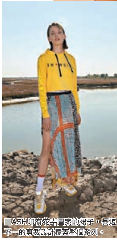
■ASH印花花卉圖案的裙子，長短不一的剪裁設計覆蓋整個系列。