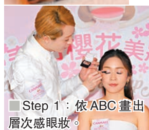
■Step 1：依ABC畫出層次感眼妝。

在使用這眼線筆時，Will 提出可以混搭日常愛用的黑色或啡色眼影，在眼尾部分加上粉紅眼線，便可營造出可愛粉紅眼妝。全新唇膏系列——Melty Luminous Rouge 柔潤亮澤唇膏，內裡配上可愛心形壓圖，融合點是依據肌膚溫度，畫一次便可以於雙唇呈現亮麗顏色，效果持久滋潤。