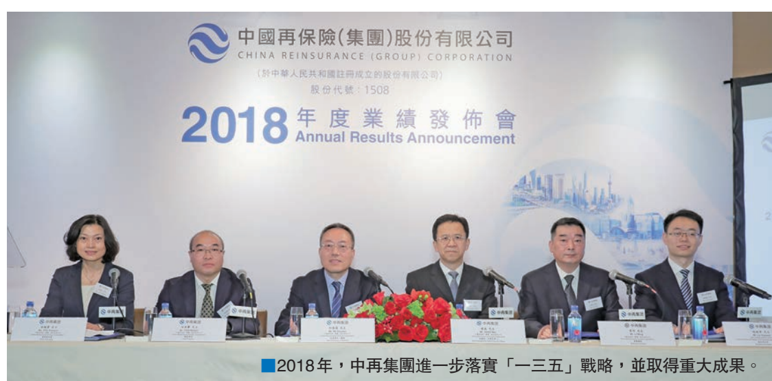
中國再保險(集團)股份有限公司 CHINA REINSURANCE (GROUP) CORPORATION 2018年度業績發佈會 Annual Results Announcement