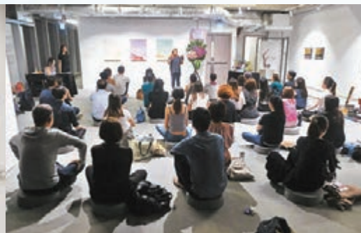
■Mindful Movement 藝術冥想會有多人出席。