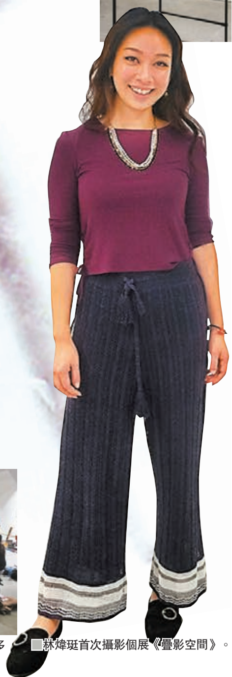
■林煒珽首次攝影個展《疊影空間》。