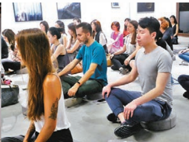
■Mindful Movement 藝術冥想會。