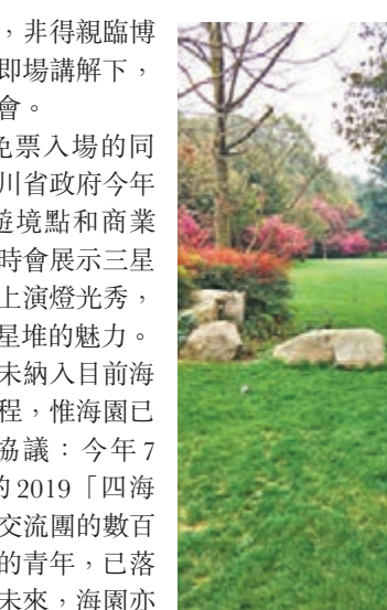
三星堆博物館所有細節都是藝術。

儘管三星堆博物館暫未納入目前海洋公園生態團的常規行程，惟海園已和三星堆博物館達成協議：今年7月，新家園協會舉辦的2019「四海一家·川港同行」青年交流團的數百名參加臥龍生態旅行團的青年，已落實加入三星堆的行程。未來，海園亦正考慮安排香港的大學生到三星堆遺址了解有關的考古工程。