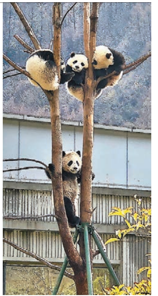
熊貓寶實爬樹會友。攝於臥龍中華大熊貓苑神樹坪基地。

相信大家在香港海洋公園看到大熊貓盈盈、樂樂，看着牠們吃飽睡、睡飽吃，內心都會感受到十分療癒。但事實上，大熊貓面對的是嚴苛的生活環境，內地通過以中國大熊貓保護研究中心為代表的大熊貓飼養繁育及科研機構的努力，已成功解決了圈養大熊貓繁育的三大難題：發情難、配種受孕難、育幼成活難，惟大熊貓繁殖仍然面臨產子困難，主要因本交成功率低，人工授精成功率偏低，又表示保護研究中心將盡最大努力，與海洋公園開展多種形式合作研究，爭取樂樂、盈盈早日實現繁殖後代的目標。 ■香港文匯報記者 陳川