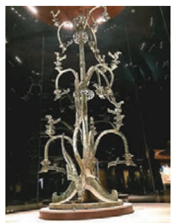
三星堆博物館鎮館之寶青銅神樹。