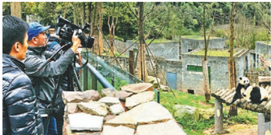
可愛的大熊貓，即使是成年人，只要親身接觸過都會瞬間愛上。攝於大熊貓保護研究中心都江堰基地。