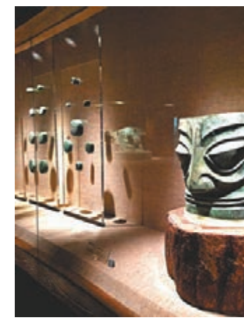
宛如外星人般的面具，引發無限遐想。