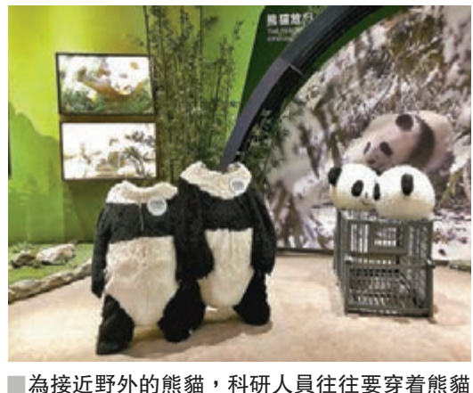
為接近野外的熊貓，科研人員往往要穿着熊貓裝才能避免發生意外。攝於臥龍中華大熊貓苑神樹坪基地。