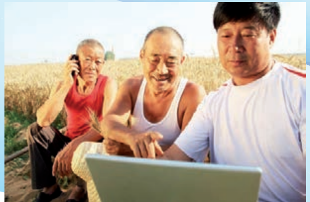
■農行互聯網金融助力數字鄉村

作總基調，持續深化體制機制改革，不斷增強發展的內生動力。持續完善公司治理，強化多元化資本補充機制，不斷增強可持續發展能力。全面推進數字化轉型，加快產品、營銷、渠道、風控等全面數字化轉型和線上線下一體化深度融合，着力打造客戶體驗一流的智慧銀行，「三農」普惠領域最佳數字生態銀行，努力「再造一個農業銀行」。