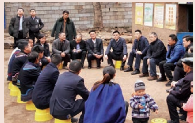
■農行管理層親赴扶貧一線召開現場會

為滿足精準服務扶貧產業項目和貧困農戶金融需求，農行還不斷加大金融扶貧產品創新力度，已累計研發推出70多項扶貧專屬產品，創新推出「油茶貸」、「扶貧養老貸」、「扶貧生態移民貸款」等特色金融扶貧產品。積極與政府、企業以及其他社會組織合作，在實踐中探索形成了政府增信扶貧、龍頭企業帶貧、特色產業扶貧、旅遊扶貧、小額信貸扶貧、民生工程扶貧、光伏扶貧等10大金融扶貧模式。