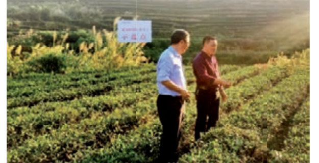
■農行工作人員在茶園調研惠農e貸

廣東清遠英德市益農生產資料經營有限責任公司是一家銷售化肥、農藥、種子、農機為主的縣域大型農產品批發商，下游直營店和經銷商有350多戶，為解決英德供銷社銷售、物流、資金結算、日常管理效率低以及下游客戶的賒銷問題，農行廣東清遠分行搭建了集客戶、渠道、場景、產品於一體的「惠農e商」電子商務服務平台，同時，針對下游眾多農資經營商、農戶及其他農村經營主體的融資需求，推出專項產品「供銷e貸」。至2018年末，該公司「惠農e商」綁定下游商戶471戶，本年累計平台訂貨交易1,151筆，交易金額達1.09億元；發放「供銷e貸」550筆，貸款餘額1,217.6萬元。英德供銷社也成為全國供銷社體制改革引入民企的試點單位。