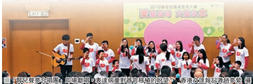
■「腎兒聲夢合唱團」即場獻唱，表達病童對器官移植的盼望。