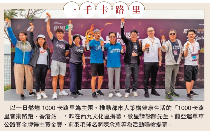
以一日燃燒1000卡路里為主題、推動都市人築構健康生活的「1000卡路里音樂路跑·香港站」,昨在西九文化區揭幕,歌星譚詠麟先生、前亞運單車公路賽金牌得主黃金寶、前羽毛球名將陳念慈等為活動鳴槍揭幕。

此外,中國足協還對擁有「歸化」球員的俱樂部提出一系列要求,比如要對入籍球員進行中華傳統文化教育,了解中國歷史和國情,制定中文學習計劃,培養愛國主義情懷。規定俱樂部指定專人負責入籍球員的思想、生活、訓練、比賽的狀態跟蹤,每月向中國足球協會提交書面報告。