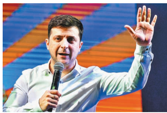
澤連斯基目前有較高支持率。