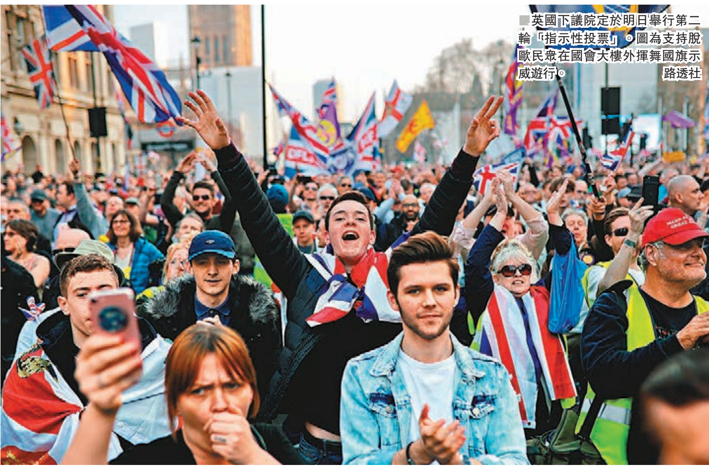
英國下議院定於明日舉行第二輪「指示性投票」。圖為支持脫歐民眾在國會大樓外揮舞英國旗示威遊行。

英國於2016年6月23日舉行公投通過脫歐，原定前日正式脫歐，距離公投日1,009天。但脫歐協議至今仍未通過，英國仍留在歐盟，何時能脫歐根本沒有答案。英國媒體諷刺這場脫歐鬧劇，形容在這逾1,000天裡，平均壽命約3年的倉鼠，甚至已過完牠的一生，「試想想，有多少倉鼠在死前仍不知道脫歐結果」。