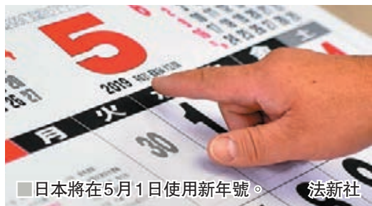
日本將在5月1日使用新年號。法新社

日本天皇明仁將於4月30日退位，沿用逾30年的平成年號屆時將結束。內閣官房長官菅義偉將於當地時間明日上午約11時30分(香港時間上午10時30分)舉行記者會，宣佈新年號。由於不論政府部門或企業，仍慣用年號記載文件的日期，因此早已作出準備，富士通和日本電氣已協助客戶，確保電腦系統不會受年號更改影響，東京港區的政府部門官員將在文件上的平成年號畫上交，並會蓋上新年號。