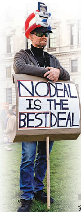
支持硬脫歐者打出標語：沒有協議就是最好的協議。

有政府官員透露，文翠珊計劃一旦任何「指示性投票」獲通過，她會把現行脫歐協議再交國會表決，與獲通過的「指示性投票」議案對決。文翠珊亦會繼續與北愛爾蘭民主統一黨(DUP)會面，進一步解釋北愛邊界「後備方案」，有傳該黨部分議員正考慮轉為支