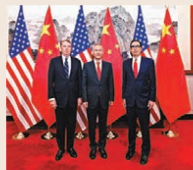
3月28日至29日，第八輪中美經貿高級別磋商在京舉行。新華社

香港文匯報訊 據新華社報道，3月28日至29日，中共中央政治局委員、國務院副總理、中美全面經濟對話中方牽頭人劉鶴與美國貿易代表萊特希澤、財政部長姆努欽在北京共同主持第八輪中美經貿高級別磋商，雙方討論了協議有關文本，並取得新的進展。劉鶴副總理將於下周應邀訪美，在華盛頓舉行第九輪中美經貿高級別磋商。