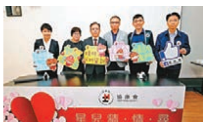
協康會公佈自閉青年戀愛調查。

香港文匯報訊(記者 文森)人人都有愛的權利,一個社福機構對自閉症及非自閉症青年進行問卷調查,發現約70%的自閉症青年從未有過戀愛經驗,比非自閉症青年少40個百分點,主要是自閉症青年認為自己不善于表達自己。當自閉症青年墮入愛河,便十分執著,曾有自閉症少女8號風球仍堅持赴約。機構強調,即使自閉症患者溝通能力較一般人低,但都有愛與被愛的需要。