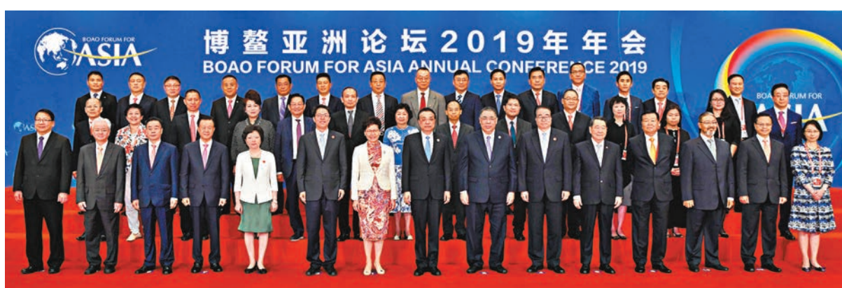
■李克強總理（前排左八）與國務院港澳事務辦公室主任張曉明（前排左六）、香港特首林鄭月娥（前排左七）、澳門特首崔世安（前排右七）及出席博鰲亞洲論壇2019年年會的部分港澳代表合影留念。

李克強27日下午會見台灣兩岸共同市場基金會榮譽董事長蕭萬長一行時也提到，台商台資為大陸經濟發展作出了重要貢獻，歡迎台商繼續來大陸投資興業。我們原有的優惠政策會繼續保持，依法保護台商台資合法權益，還將不斷推出新的惠台措施，確保取得實實在在的成效。台資企業既可參照或比照適用新的外商投資法，也能享受和大陸企業一視同仁的待遇，大陸減稅降費舉