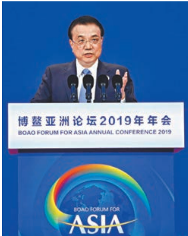
■昨日，李克強在海南博鰲出席博鰲亞洲論壇2019年年會開幕式，並發表主旨演講。