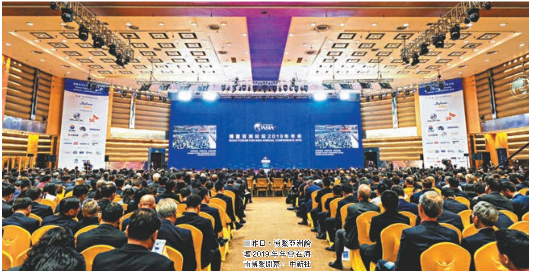
■昨日，博鰲亞洲論壇2019年年會在海南博鰲開幕。

香港文匯報訊 綜合新華社、中新社報道，國務院總理李克強昨日上午在海南博鰲出席博鰲亞洲論壇2019年年會開幕式，並發表題為《攜手應對挑戰實現共同發展》的主旨演講。李克強表示，中國將進一步放寬外資市場准入，全面實施准入前國民待遇加負面清單管理制度。今年6月底之前，我們將再次修訂發佈外商投資准入負面清單、自由貿易試驗區外商投資准入負面清單、鼓勵外商投資產業指導目錄，進一步縮減負面清單條目。來自五大洲60多個國家和地區的2,000多位政界、工商界代表和智庫學者參加了論壇開幕式。