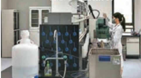
■《粵港澳大灣區發展規劃綱要》明確支持中山推進生物醫藥科技創新。

醫療技術及先進設備，把股改後的中山市陳星海醫院逐漸建設成香港中文大學醫學院和香港港安醫院的中山基地，並打造成為大灣區高端醫療中心。