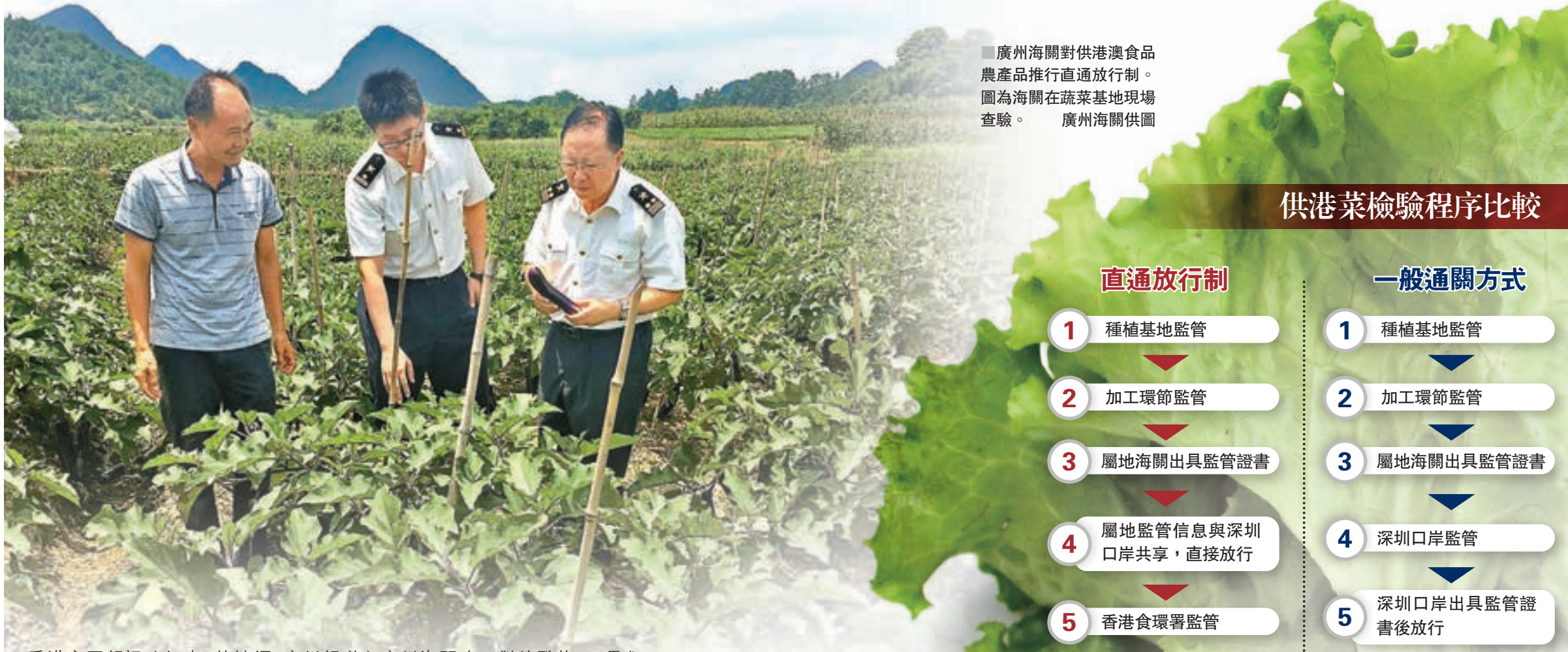
■廣州海關對供港澳食品農產品推行直通放行制。圖為海關在蔬菜基地現場查驗。