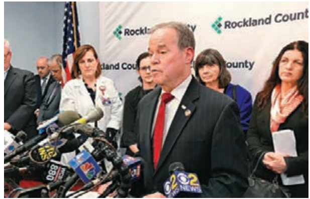
■ 縣長埃德·戴頒佈緊急狀態令，將事件界定為「公共衛生危機」。

美國多地去年起爆發嚴重麻疹疫情，其中位於紐約近郊的羅克蘭縣，自去年10月起先後有多達153人受感染，成為全國重災區。羅克蘭縣不少居民是正統派猶太教徒，他們在宗教原因及反疫苗人士影響下，長年拒絕為子女接種麻疹、流行性腮腺炎及德國麻疹混合疫苗(MMR)，導致社區免疫力不足。為免疫情進一步蔓延，縣政府前日頒佈緊急狀態令，禁止從未接種疫苗的兒童或青少年進入學校、食肆或商場等室內公眾場所，違令兒童的父母可能被判監。