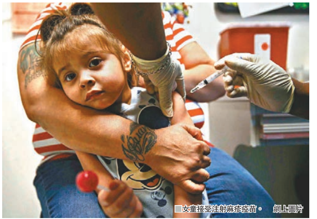
■ 女童接受注射麻疹疫苗。