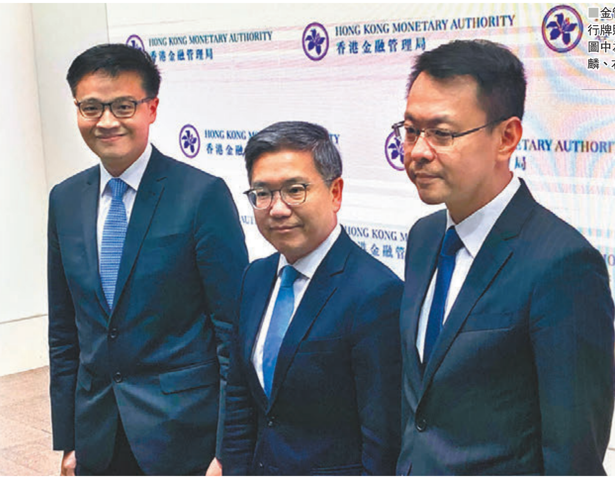
金管局昨天發出首批銀行牌照以經營虛擬銀行。圖中為阮國恒、左為區毓麟、右為陳景宏。

香港文匯報訊（記者馬翠媚）本港首批虛擬銀行終於出爐，金管局昨發出首批3張虛擬銀行牌照，全部由合營公司奪得，包括分別以中銀香港、渣打香港及眾安在線為首的合營公司，合營公司的股東亦全部有內地科網公司。金管局副總裁阮國恒昨表示，引入虛擬銀行旨在促進普及金融及推動本港金融科技，預計虛擬銀行發牌後會在6至9個月推出服務，而首個階段料先以簡單存貨業務為主，待日後運作成熟，再與業界商討拓展其他業務。