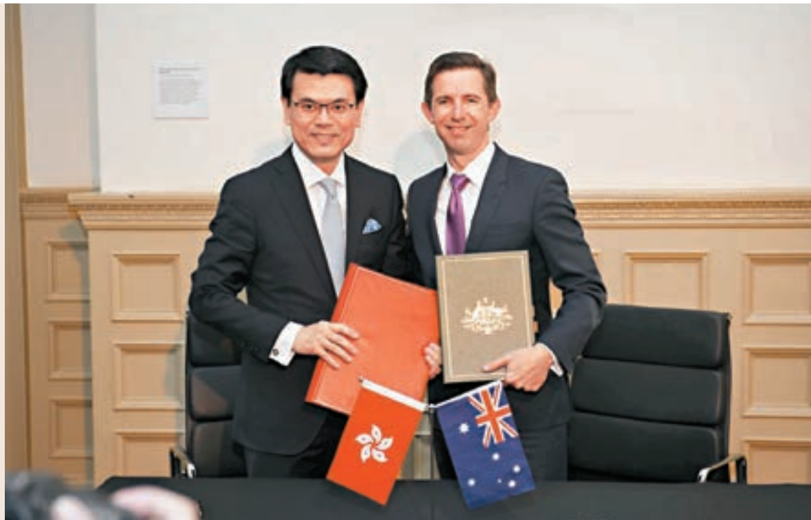
商務及經濟發展局局長邱騰華(左)昨天在澳洲悉尼出席香港與澳洲《自由貿易協定》和《投資協定》簽署儀式。右為澳洲貿易、旅遊和投資部長伯明翰。

香港文匯報訊 香港與澳洲昨日簽訂《自由貿易協定》和《投資協定》，兩份協定涵蓋範圍全面，包括貨物貿易、服務貿易、投資、知識產權、政府採購、競爭事宜及其他相關範疇。特首林鄭月娥表示，在未來日子裡會繼續為香港開拓更多市場，簽訂更多雙邊和多邊貿易協定。商務及經濟發展局局長邱騰華則表示，自貿協定生效後，香港原產貨物可即時透過簡易的申請程序，完全以零關稅進入澳洲市場，這是澳洲給予其自貿協定夥伴的最佳關稅待遇。