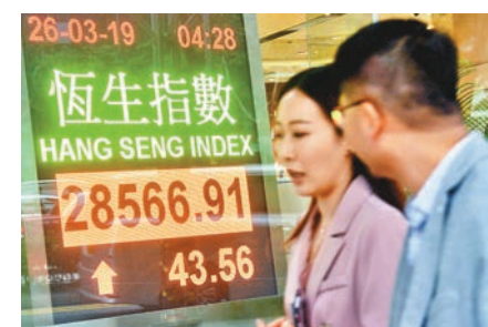
由於A股昨午跌幅擴大，令一度升178點的港股午後倒跌。

港股方面，由於A股昨午跌幅擴大，滬指收跌1%，令一度升178點的港股午後倒跌，全日收報28,566點，升43點，成交縮至1個多月以來最少的886億元。分析師指，近月港股造好很大程度上因為A股強勢所推動，但昨日滬指已跌穿3,000點心理關口，這肯定會打擊到港股的投資氣氛，故此，大市交投亦見收縮。